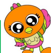
元気一番!! ふっちゃん体操イメージ キャラクター ひびー